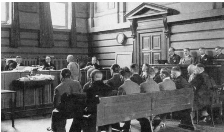
Verhandlungssaal des Altonaer Sondergerichts am 8. Mai 1933: Im Prozess wurden die ersten politischen Todesurteile des NS-Regimes gefällt.

Auch in diesem Jahr trafen wir uns auf dem ehemaligen Gefängnishof hinter dem Amtsgericht Altona. Auf Initiative der Kreisvereinigung Altona und mit Geldern des Bezirks wurde im vergangenen Jahr eine kleine Gedenktafel aufgestellt, respektive instand gesetzt. Das Schild erinnert an Karl Wolf (KPD), Bruno Tesch (Kommunistische Jugend), August Lütgens (KPD) und Walter Möller (Antifaschistische Aktion), die am 1. August 1933 genau hier mit dem Handbeil enthauptet wurden. Zuvor hatte sie das Sondergericht Altona mit gefälschten Zeugenaussagen stellvertretend für den Widerstand gegen den SA-Aufmarsch