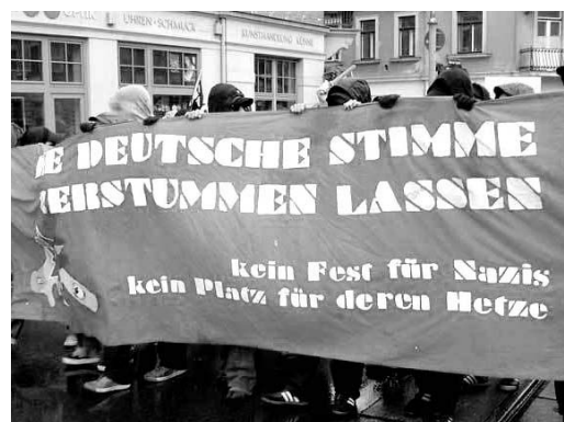
600 Antifaschisten demonstrierten am 5. August gegen das NPD-Pressesfest durch Dresden.

Zum Pressesfest der Parteizeitung der NPD kamen nach Polizei-