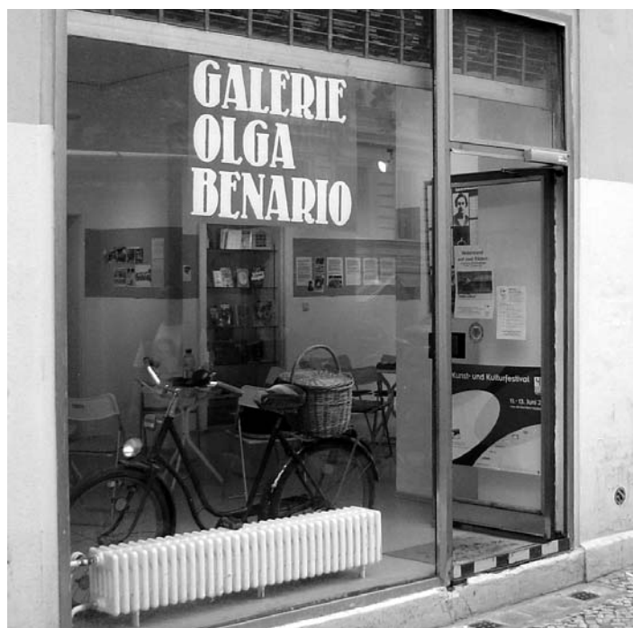
Die Galerie »Olga Benario« in der Richardstraße 104.

Die »Galerie Olga Benario« gibt es seit 22 Jahren. Sie wurde von Mitgliedern der VVN-BdA in Berlin-Neukölln gegründet.