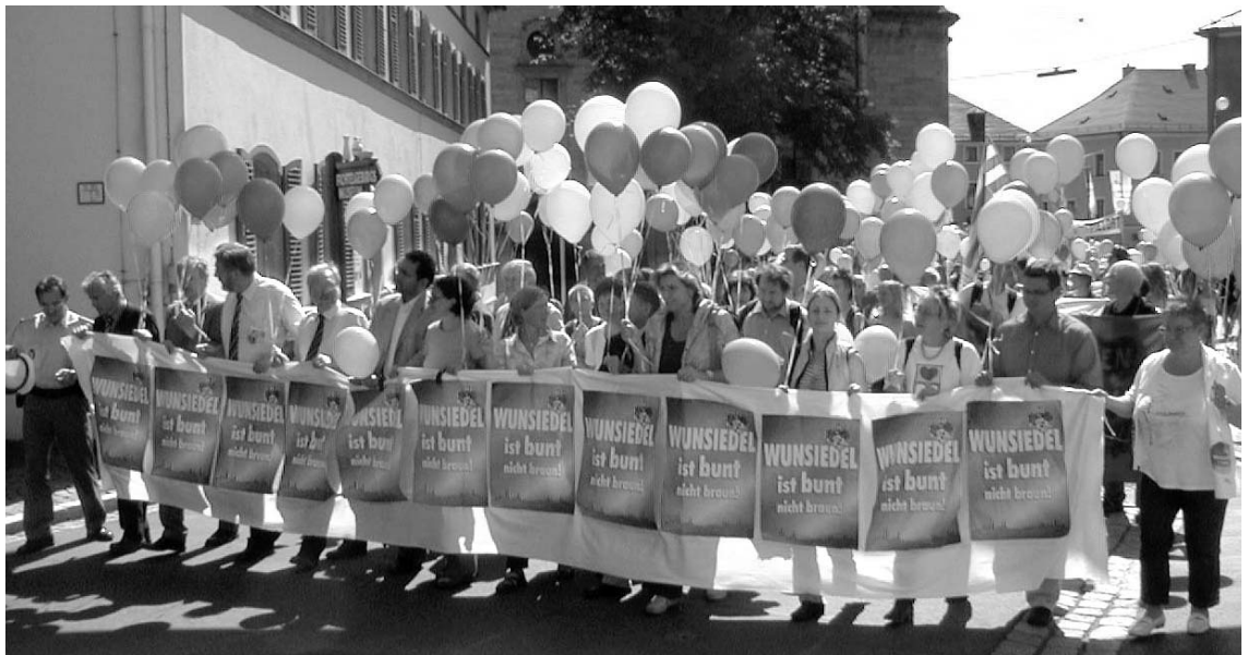
»Tag der Demokratie« in Wunsiedel: Ein breites Bündnis stellte sich den Nazis in den Weg.

Durch den in viele Sprachen übersetzten Appell und dessen Verbreitung trugen die VVN-BdA und die Jugend der VVN nicht unerheblich zur Mobilisierung auf den 20. August 2005 in Wunsiedel bei. Nach fast 20 Jahren antifaschistischen Widerstandes gegen den