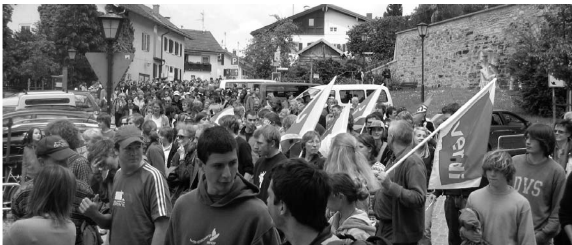
Demonstration gegen Neonazis im Juni 2006 in Murnau.

Engagement im Oberland: Murnauer gegen Nazi-Stützpunkt