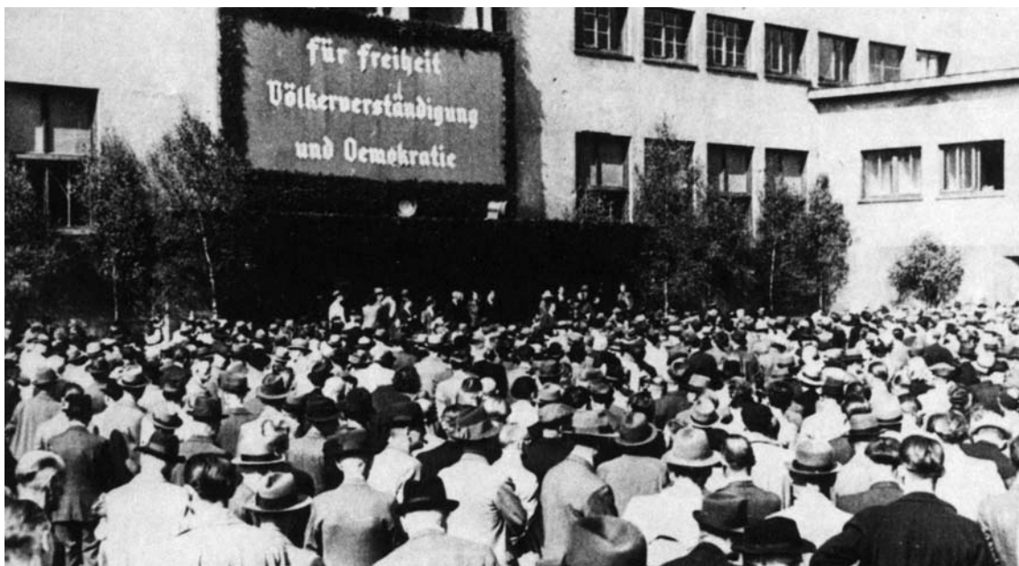
Maifeier 1946 in Frankfurt im Gebäude der damaligen AOK am Sachsenhäuser Mainufer.