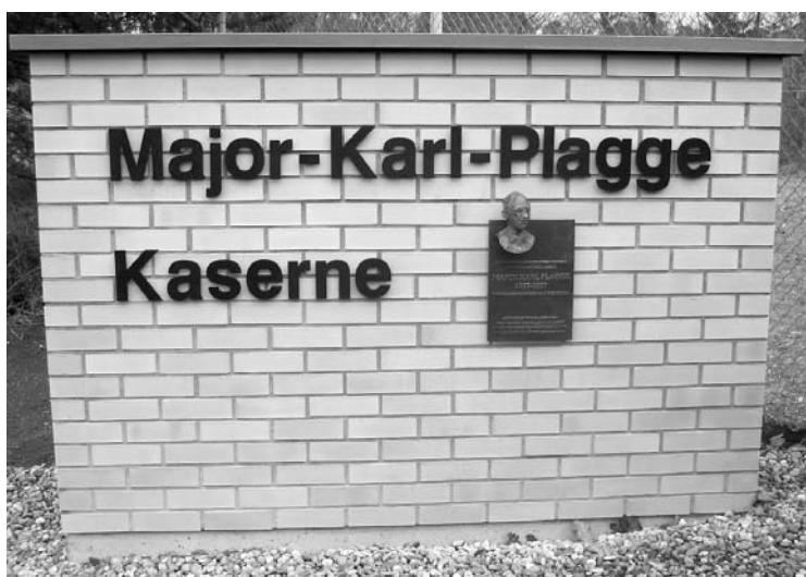
Karl Plagge rettete in Vilnius jüdische Zwangsarbeiter. Seit Februar ist eine Darmstädter Kaserne nach dem Offizier benannt.

Zu der verschwindend kleinen Minderheit der »Retter in Uniform« gehört der aus Darmstadt stammende ehemalige Wehrmachtsmajor Karl Plagge (1897-1957), dem von 1941 bis 1944 in Wilna, dem heutigen Vilnius, ein Wehrmachtsfuhrpark mit 250 Untergebenen unterstand, der seine Funktion dazu nutzte, den dort eingesetzten jüdischen Zwangsarbeitern das Leben zu erleichtern, der nach der Liquidierung des Wilnaer Ghettos im September 1943 der SS die Einrichtung eines Arbeitslagers für ungefähr 1 500 Zwangsarbeiter mit Familien (!) abrang. Beim Abzug der deutschen Besatzer vor