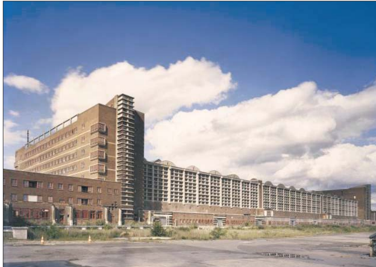
Großmarkthalle Frankfurt am Main: Bald EZB-Sitz mit Gedenkstätte.

Die Prozedur hat lange gedauert, aber es ging auch nicht um etwas Alltägliches, sondern um etwas Einmaliges: Um eine würdige Gedenkstätte an der ehemaligen Frankfurter Großmarkthalle, demnächst Ort der Europäischen Zentralbank, zur Erinnerung an die 11 000 Frankfurter Juden, die seit 1941 von den Nazis in die Keller der Großmarkthalle getrieben und von hier aus in Konzentrations- und Vernichtungslager deportiert wurden.