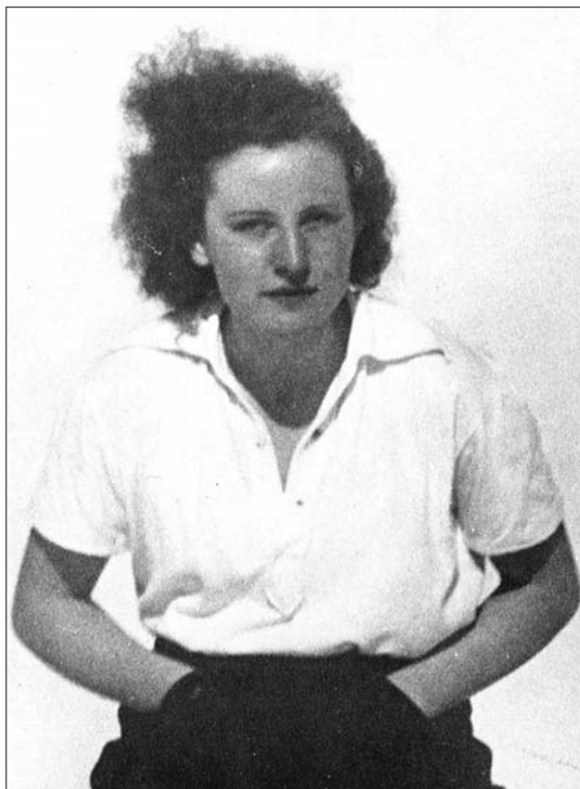
Ilse Stöbe, Mitte der Dreißiger Jahre.

Ilse Stöbe gehört zu den Deutschen, die früh bereit waren, aktiv gegen das Hitlerregime zu kämpfen, und deswegen wurde sie im Jahr 1942 im Alter von 31 Jahren hingerichtet wurden. Im Mai 1911 geboren, wäre sie am 17. Mai 2011 hundert Jahre alt geworden.