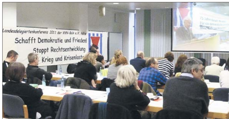
Mit einer Video-Rede des unvergessenen Jupp Angenfort wurde die Konferenz eröffnet.

Die 76 Delegierten der 21 Kreisvereinigungen der VVN-BdA aus Nordrhein-Westfalen tagten unter dem Motto: »Schafft Demokratie und Frieden! Stoppt Rechtsentwicklung, Krieg und Krisenlasten!« Die Landesdelegiertenkonferenz fand auf Einladung der Gewerkschaft Verdi in deren Landeszentrale in Düsseldorf statt. Um der faschistischen Gefahr, der Kriegspolitik und dem Sozialabbau zu begegnen, entwickelt und beteiligt sich die VVN-BdA NRW an breitesten Bündnissen, wurde betont. »Alle, die die Neofaschisten bekämpfen, sind als Bundesgenossinnen und Bundesgenossen willkommen.« So heißt es in einem beschlossenen Leitantrag. Besonders strebt die VVN-BdA NRW die intensivere Zusammenarbeit mit den Gewerkschaften und Migran-