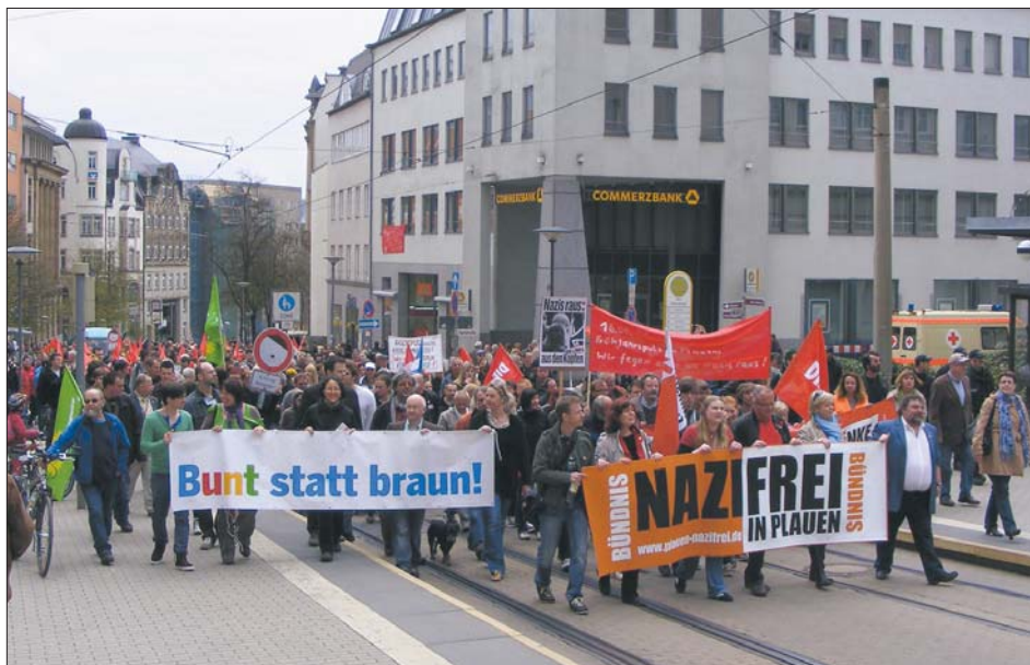
750 Bürgerinnen und Bürger forderten: Plauen soll nazifrei sein.

Am Sonnabend, 16. April 2011, fanden sich, dem Aufruf des Bündnisses »Nazifrei in Plauen« folgend, etwa 750 Menschen aus der Stadt und dem gesamten Vogtland in Plauen ein, um dem braunen Spuk ein deutliches Zeichen entgegen zu setzen. Zwei Marschkolonnen bewegten sich auf den Plauer Albertplatz zu. Vor einem breiten Transparent mit der Aufschrift »Wir machen heute sauber – der braune Dreck muss weg!« kehrten Verdi-Frauen symbolisch die August-Bebel-Straße, während vom Postplatz ein beeindruckender Demonstrationzug die Bahnhofstraße herauf kam. An der Spitze gab es Transparente »Bunt statt braun!« und des Bündnisses »Nazifrei in Plauen«, getragen von Sprechern des Bündnisses und Bundes- und Landtagsabgeordneten mehrerer Parteien.