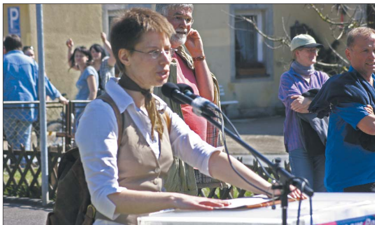
Die »Gegenlesung« in Pommersfelden gegen ein »Lesertreffen« von Ultrarechten ...

Erst noch zögerlich schlossen sich schließlich auch die Gemeinde, die örtlichen Kirchen, weitere zivilgesellschaftliche Organisationen und der Besitzer des Schlosses Weissenstein, Paul Graf von Schönborn, unserem Protest an. Der Besitzer war noch kurz vor un-