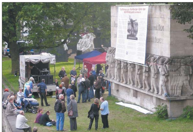
Das erste Friedensfest am »Kriegsklotz« vom September 2010.

Auf dem Programm stehen Ansprachen, Lesebeiträge, Lieder der Gruppe »Rotdorn« und das Schauspiel »Kriegsgericht«. Ab 16.30 Uhr startet dann die Kunstaktion »Versäumtes nachholen«. Das Kriegerdenkmal wird in Folie gewickelt und bleibt über 14 Tage in dieser Gestalt erhalten. Am 21. Mai wird ab 15 Uhr das Denkmal bei Sekt und frechen Liedern wieder ausgepackt. René Senenko