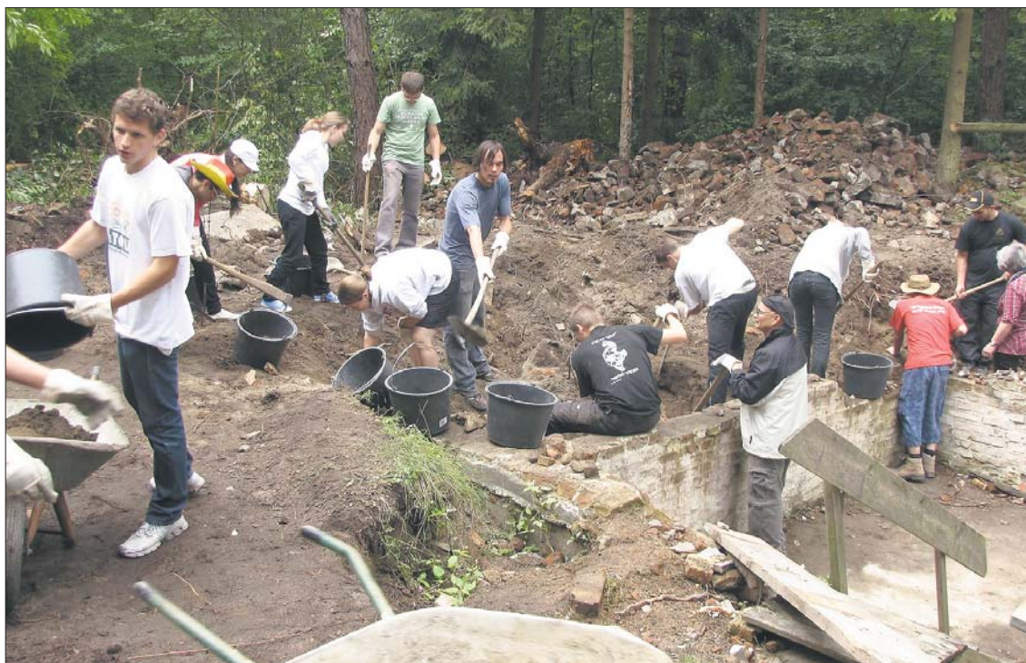
Junge Roma, Israelis und Deutsche bei der gemeinsamen Arbeit an der KZ-Außenstelle Walldorf.

Die Margit-Hovarth-Stiftung, die die Erinnerungsarbeit junger Menschen unterstützt, hatte das 75jährige Bestehen des Frankfurter Flughafens zum Anlass genommen, mit Unterstützung der Fra-