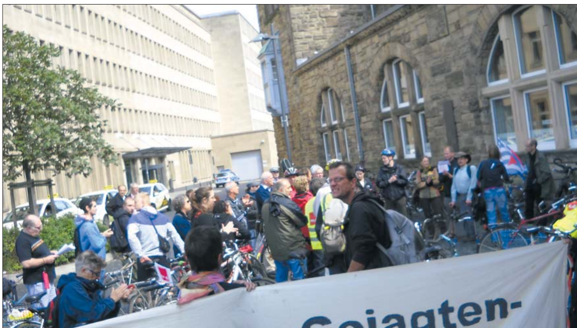
Braune Spurensuche in Aachen: Fahrradkorso auf dem Synagogenplatz.

Neun Stationen erradelten die Demonstranten. Zum Kiosk der