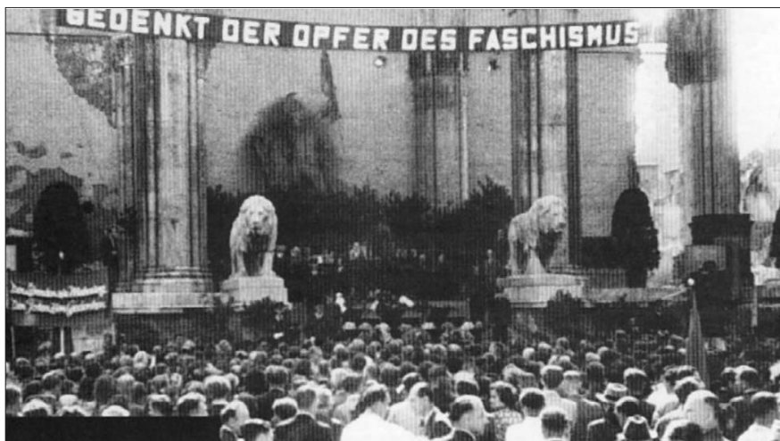
Große Gedenkkundgebung für die Opfer des Faschismus am 14. September 1947 in München.

Eine spannende Veröffentlichung des Kulturreferates