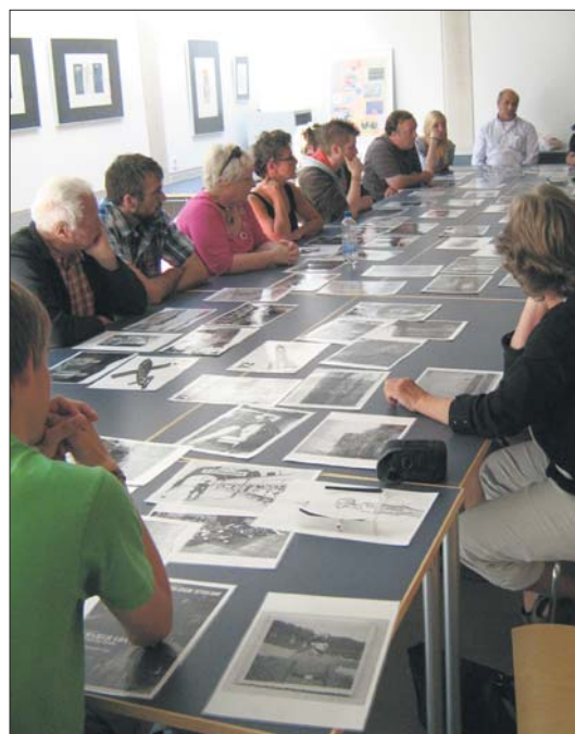
Informationsgespräch über die Geschichte des Lagers.

Unvergesslich bleibt vor allem der Teil der Stollen, in dem die Häftlinge am Beginn, also noch vor Beginn der Produktion, hausen mussten – in Dunkelheit, in Kälte, ohne Decken, ohne Wasser zum Trinken, ohne Wasser zum Waschen, praktisch ohne Toiletten,