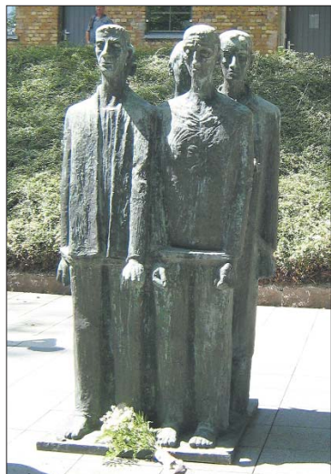
Mahnmal von Jürgen v. Woyski.

Nachdem Chaim, unser Begleiter in der Gedenkstätte, das jüdische Gebet für die Opfer der Shoa gesprochen hatte, betreten wir den im