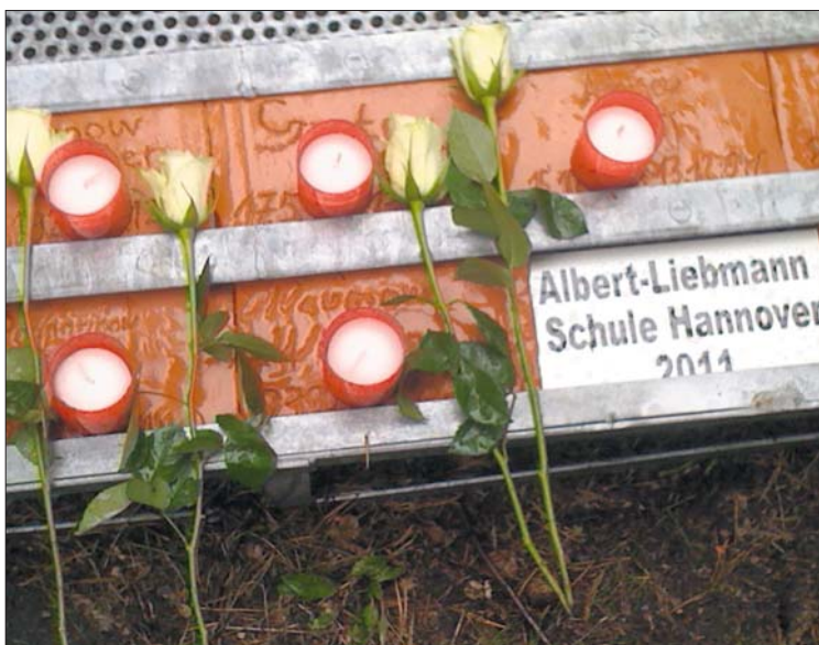
Die Opfer erhalten ihre Identität zurück: Schüler fertigen Tontafeln an.

Von einigen der Toten gibt es weitere ergänzende Daten, die dann von den Schülerinnen und Schülern bearbeitet werden. Dadurch erhalten diese Menschen ihre Identität zurück, die ihnen die Nazis nahmen. Das Beschäftigen mit einzelnen umgekommenen Menschen macht aus ihnen Personen mit einem individuellen Leben, während die große Zahl die Opfer abstrakt macht. Inzwischen sind es bereits an die