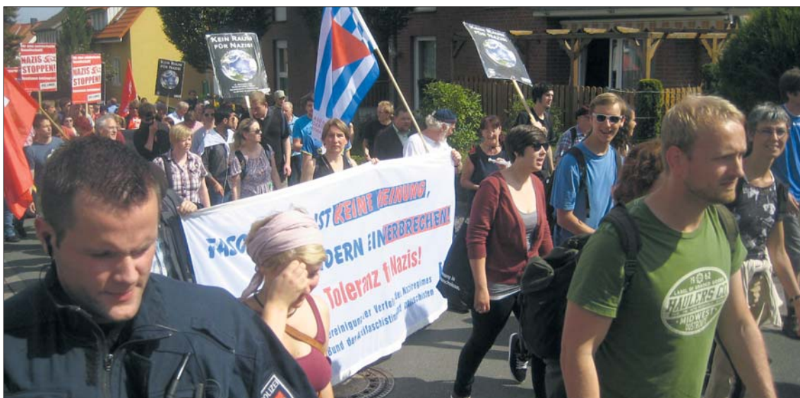
Breites Bündnis gegen Nazis: Demonstration gegen den neofaschistischen »Trauermarsch« durch die Stadt.

Aber die Übersichtlichkeit hat auch ihre Vorzüge: Von Jahr zu Jahr gelingt es besser, die Bewohner der Stadt, Parteien, Religionsgemeinschaften, Vereine und Geschäftsleute dagegen zu mobilisieren, dass sich dort ein Wallfahrtsort der Faschisten etabliert. Eine zentrale Rolle bei dieser Initiative »Bad Nenndorf ist bunt« kommt der