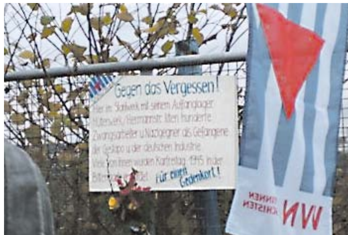
Eine Aktion am Zaun des ehem. Stahlwerkes - jetzt Phönixsee. Gegen Vöglar, Vereinigte Stahlwerke in Dortmund-Hörde.

Dabei kamen neben den deutschen Beschäftigten, so Dr. Ralf