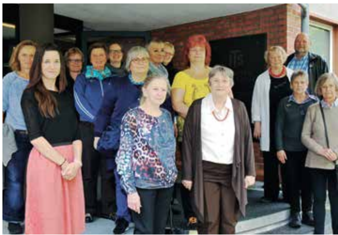
Teilnehmerinnen und Teilnehmer an der Jahrestagung der LGRF vor dem Gebäude des Internationalen Suchdienstes in Bad Arolsen.

Das diesjährige Treffen vom 29. September bis zum 2. Oktober 2016 stand unter dem Motto: »Erinnerung an Ravensbrück in Hessen«. Dabei war der Blick nicht nur auf die Geschichte gerichtet. Man war vielmehr bemüht, sie auch mit der Gegenwart zu verbinden. Tagungsort war die Bildungszentrale der ver.di-Jugend in Naumburg in Nordhessen. Das Programm wies gleich drei Höhepunkte auf: Da war zum einen der Besuch beim Internationalen Suchdienst (ITS) in