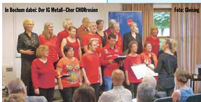
In Bochum dabei: Der IG Metall-Chor CHORrosion

In diesem Jahr wird die Vereinigung der Verfolgten des Nazi-regimes (VVN) 70 Jahre alt. Das Ereignis war Anlass zu einer Kulturveranstaltung am 29. Oktober in Düsseldorf. Bereits vier Wochen zuvor vor 70 Jahren, im September 1945, war die VVN in Bochum gegründet worden. Dort wurde der Reigen der Jubiläumsveranstaltungen »70 Jahre VVN« am Samstag, 24. September 2016, im Bochumer Ver.di-Gewerkschaftshaus eröffnet.