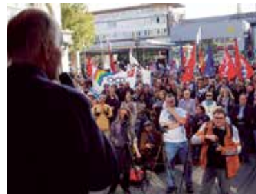
Kundgebung im Anschluss an die Protestdemo am 3. Oktober 2016 in Essen

wenn die Infrastruktur zusammengebrochen ist. Die Friedensfreunde meinten, gerade in Europa mit seiner hoch entwickelten Industrie können die »modernen Kriege« nur zur Massenvernichtung ohne Chance auf weitere Existenz führen. Deshalb muss alle Kraft auf die Verhinderung eines solchen Infernos gelegt werden.