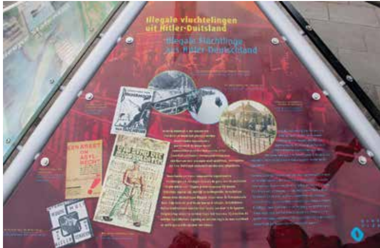
Blick auf die Gedenktafel für die niederländischen Fluchthelfer von naziverfolgten Deutschen, die am 8. Oktober 2016 feierlich in der Gemeinde Oldambt eingeweiht wurde.

Am 8. Oktober 2016 wurde im Rahmen einer von der niederländischen Gemeinde Oldambt organisierten Gedenkfeier eine Tafel zu Ehren der niederländischen Fluchthelfer verfolgter deutscher Antifaschisten eingeweiht.