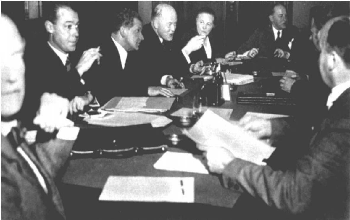
Abb. 1: Preußische Akademie im Herbst 1933: Rudolf Binding, Werner Beumelburg, Hanns Johst (Vorsitzender), Hans Friedrich Blunck, Agnes Miegel, Börries von Münchhausen, Erwin Guido Kolbenheyer; im Bild verdeckt sind Emil Strauß, Hans Grimm und Wilhelm Schäfer