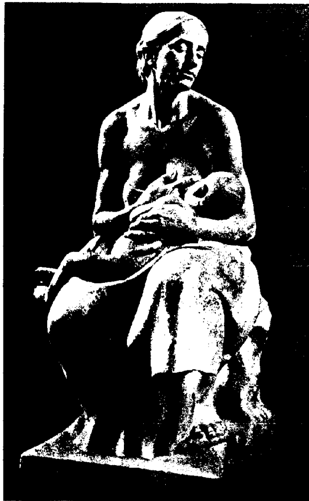
Plastik von Bildhauer Hermann Joachim Pagels