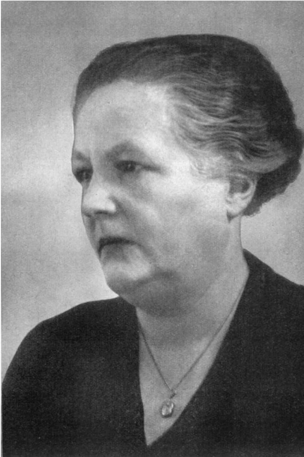
Abb. 3: Agnes Miegel (1938)