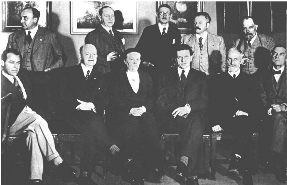
Abb. 2: Mitglieder der Preußischen Akademie: „1936 gehörten der Akademie nur noch jene Schriftsteller an, die sich zu Hitlers Propagandisten gemacht oder kapituliert hatten. Vorn: Beumelburg, Blunck, Miegel, Johst, Strauß, Binding; hinten: Vesper, v. Münchhausen, Hans Grimm, Kolbenheyer und Schäfer“