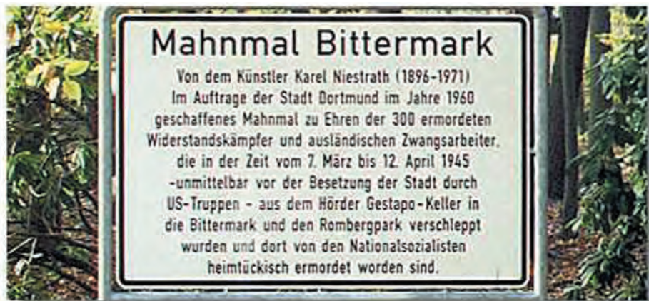
Schild am Tatort der Morde der Gestapo vom Frühjahr 1945