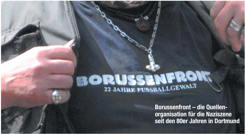
Borussenfront – die Quellenorganisation für die Naziszene seit den 80er Jahren in Dortmund