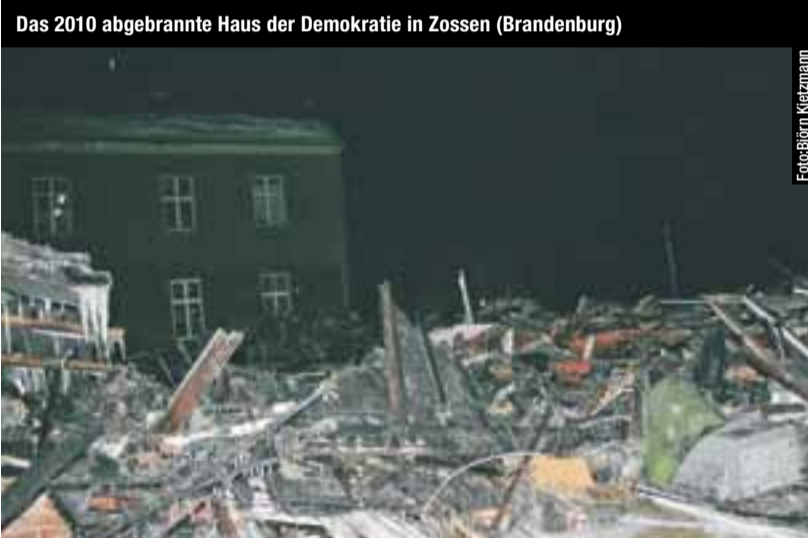
Das 2010 abgebrannte Haus der Demokratie in Zossen (Brandenburg)

Schmidtkes Hilfe kann es weitergehen. Er meldet Aufmärsche an, betreibt Internetseiten, besorgt Propagandamaterial und tritt als Pressesprecher in Erscheinung. In diesem Sommer hat er den Laden »Hexogen« (Bezeichnung für Sprengstoff) aufgemacht und verkauft »alles für den Aktivist«. Ausgerechnet in einem Kiez, in dem ohnehin schon viele Neonazis ihr Unwesen treiben.